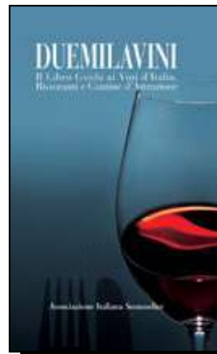
Duemilavini Annuario 2004

Tipologia: Bianco Igt - Uve: Sauvignon 90%, Chardonnay 10% - Gr. 13,5% - € 12,50 - Bottiglie: n.d. - Di colore giallo paglierino intenso, esprime all'esame olfattivo nobili sentori di pesca bianca, fiore di glicine, salvia e foglia di pomodoro. Caldo e pieno in bocca, promette un equilibrio non lontano e mostra una morbidezza notevole, che invita al riassaggio. Buona la persistenza. Vinificazione in acciaio con sosta in vasca di 6 mesi. Su un risotto ai gamberetti con punte di asparagi.